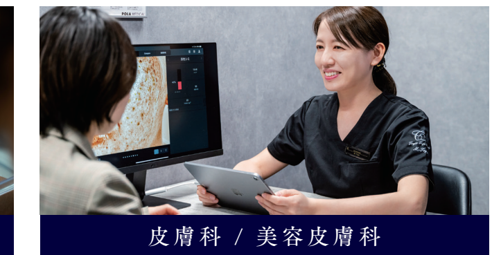
皮膚科 / 美容皮膚科

「痛みからの解放と健康寿命の延伸」をスローガンに掲げる。院長自身が「整形外科に行っても湿布・痛み止め・電気をやられるだけ」という患者の声を問題視しており、痛みの根本原因を解決するための治療を重視。整形外科専門医による診断と、経験豊富な理学療法士による運動療法を密接に連携させ、最適な治療計画を立案・実行する。