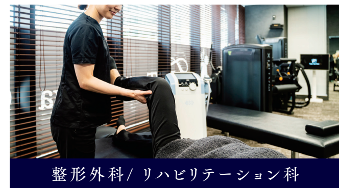
整形外科 / リハビリテーション科