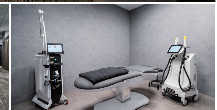
市営地下鉄七隈線「天神南」駅から徒歩1分という好立地も魅力のこちらのクリニックには、体組成測定器「InBody」やジョンソンヘルステック社の「MATRIX」などを備えたパーソナルトレーニングルームを完備。また、ダークグレーを基調にした院内は落ち着いた雰囲気、診療や支払いの待ち時間もゆとりと過ごすことができる。美容皮膚科では、IPL治療器「Nordlys(ノーリス)」や高周波(RF)治療器の「XERF(ザーフ)」といったダウンタイムが短く、施術時に強い痛みを伴わない機器を導入。低刺激で効果的なエイジングケアを目指している。